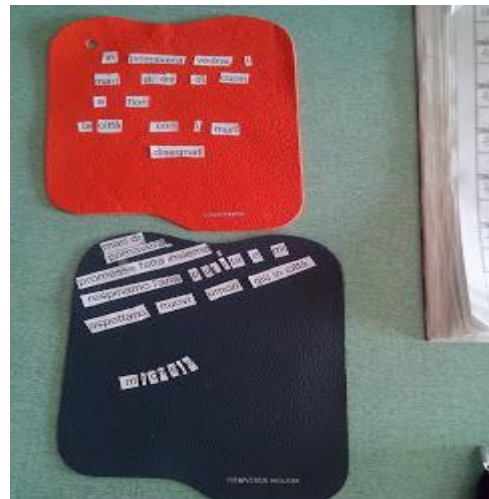
Qualcuno si sofferma ad impreziosire lo sfondo...