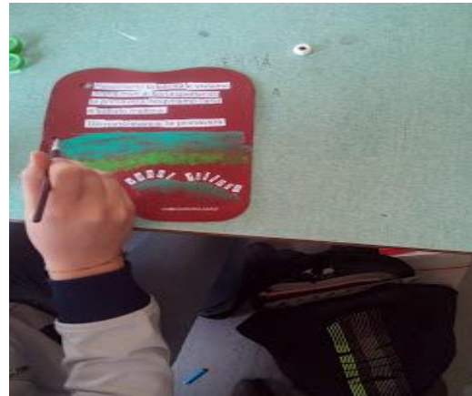
Qualcuno consegna i lavori...